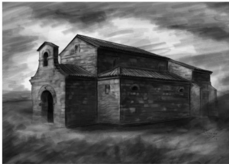
Basilica de San Juan de Baños, Palencia.

Todo aquello quedó reducido a polvo en 711, cuando el Reino visigodo de Toledo cayó bajo los efectos combinados de una invasión extranjera y una nueva guerra interior. Pero su huella se mantuvo viva, como un débil eco, en el arte asturiano posterior. Sería otra España de piedra y oro.